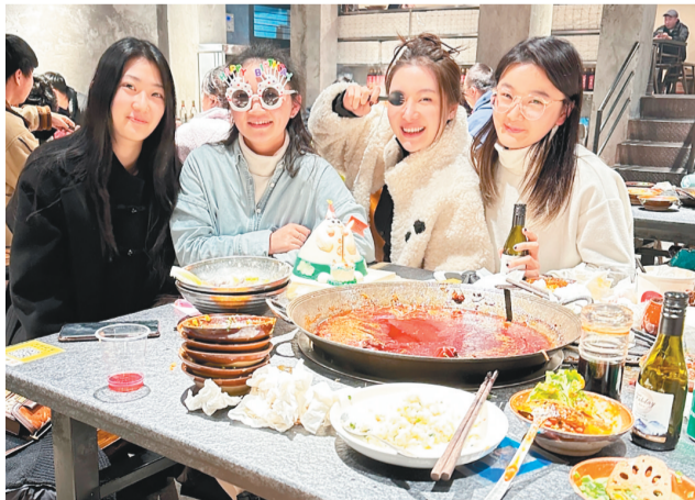
一起合影留念

“三个姐姐都好热情，还教我涮毛肚，调制蘸料。”王同学说，虽然刚开始有点害羞，但觉得姐姐们十分有趣，因为自己听