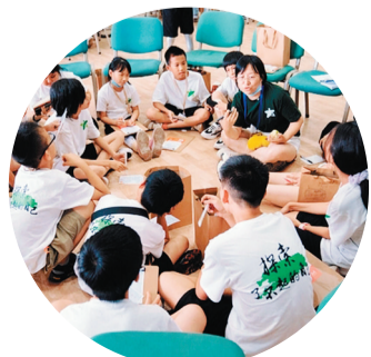
2022年夏令营 资料图片