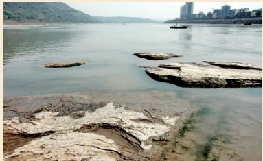
宛如一朵硕大的莲花盛开在江面