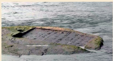
难得一见真容的莲花石