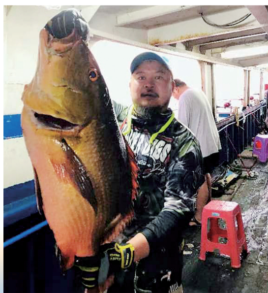
收获了条西沙红鲈

也有让人后怕的经历。2018年11月的一晚，他在东海海钓鳕鱼时，突遇十一二级强风。巨浪从顶上打下来，引发船上电源短路。接下来的时间，黑暗中耳里只有风暴的怒吼，船在浪谷浪峰里不停跳跃。刚开始船上下波动，他知道这是安全的。后来船左右摇摆，他第一次感到了绝望，因为这往往是船倾覆的前兆。海水一次次扑打进舱里，他和15个海钓爱好者躺在早已湿透的床上，没有人说话，巨大的恐惧笼罩着每一个人。“那时，我居然想到了老家唐家沟。”这一闪念更加深了他不祥的感觉……炼狱般的3小时过去了，风浪终于平静下来，他冲上甲板，大口大口呼吸着又腥又咸的空气，难掩劫后余生的激动。“这次真的让我看到了人的渺小和无奈。”此后很多年，他不敢再去东海海钓。