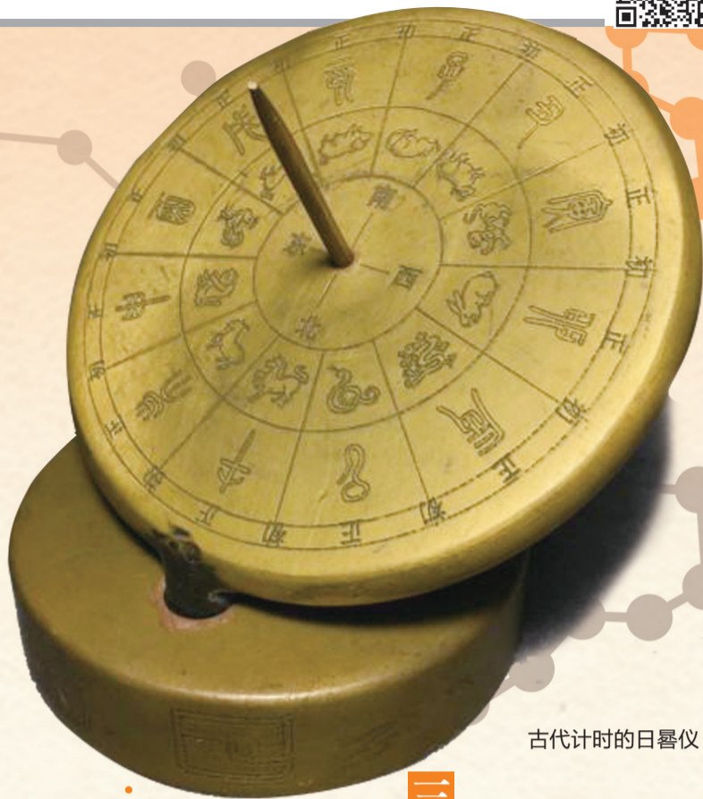
古代计时的日晷仪

经过一年多反复修改、推敲，易稿数十，终于编修成《考定中星图》初稿。稿内按照二十四节气绘制出24幅星图，考定了各个节气中的星名及其出没的规律，并配写了“中星歌”。咸丰五年（1855年）江蕙特为这本书稿写了跋，这年江蕙才17岁。但由于受封建礼教思想的束缚，她将该书稿“谨藏闺阁”。次年，18岁的江蕙再次对《考定中星图》作补注，最后定稿，但她仍“不敢示人”。