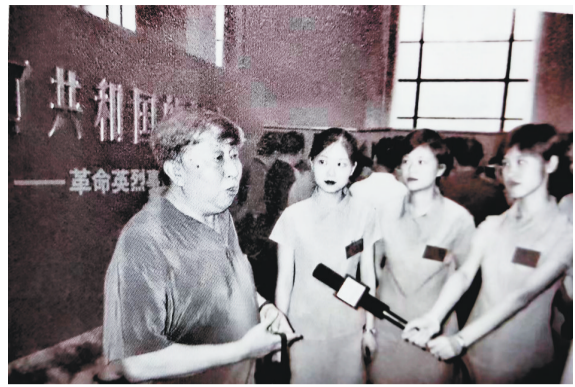
阎肃接受重庆媒体采访