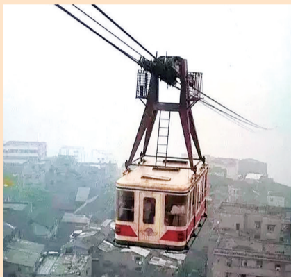
20世纪80年代的重庆长江索道