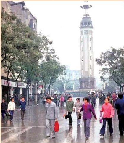
20世纪80年代的重庆解放碑