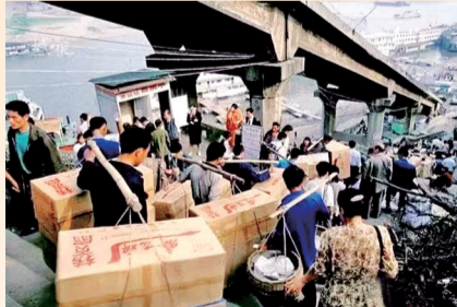
20世纪80年代,繁忙的朝天门码头