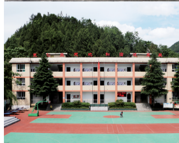
彭水县长生观旧址上的长生小学 彭水县长生镇冯洪瑞供图