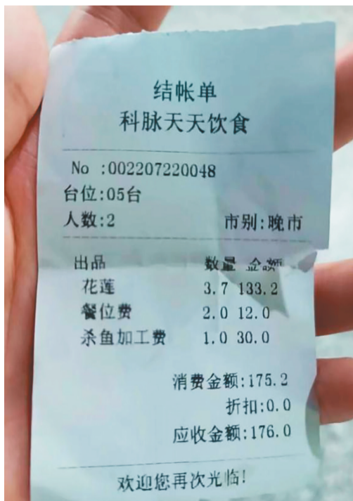
网友吐槽在该店消费遭遇“反向抹零”