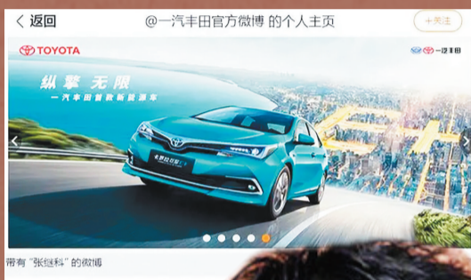
一汽丰田官方也已经删除了张继科的全部动态，并且下架了与其有关的全部宣传物料。