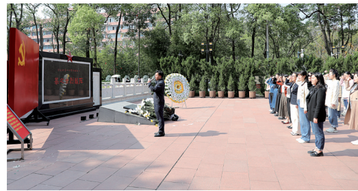
市总工会青年干部开展清明祭扫活动

4月3日,在清明节即将到来之际,市总工会组织青年干部走进红岩革命历史博物馆、歌乐山烈士陵园等地,开展“缅怀革命先烈,传承红色基因”清明祭扫活动。