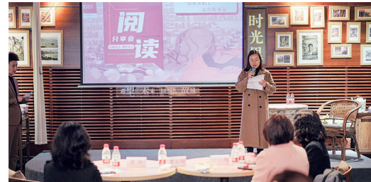
市机械冶金工会举办主题阅读分享活动

3月30日,市机械冶金工会开展了“情系女职工法在你身边”主题阅读分享活动,以读书交流的形式进一步提高女职工的法律意识、依法维权能力。活动现场邀请了女职工权益保护法律专家、企业女职工委员会主任和女劳模工匠代表进行了主题分享交流。还向企业赠送了《促进工作场所性别平等指导手册》《创建家庭友好型工作场所指导手册》《女职工权益维护法律知识微手册》等书籍。