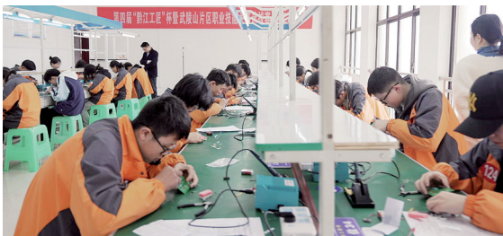
黔江区第四届“黔江工匠”杯暨武陵山片区职工职业技能大赛选拔赛现场