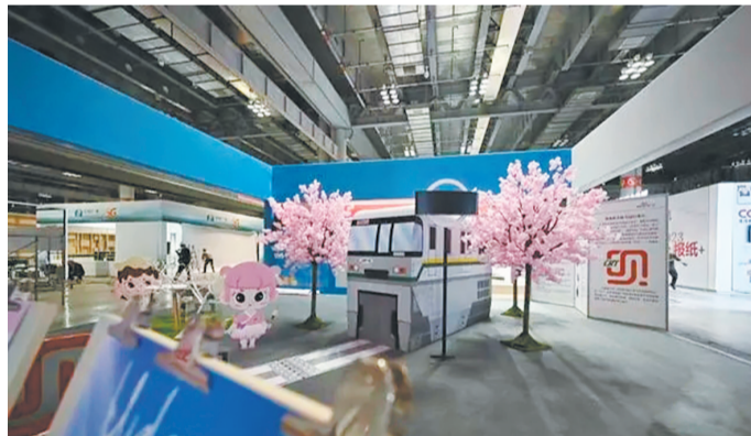
被复刻到文博会展厅的“开往春天的列车”