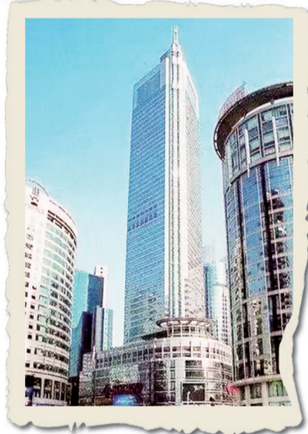
◀ 位于临江门的世贸大厦