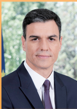
西班牙首相桑切斯