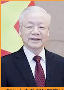
越共中央总书记阮富仲