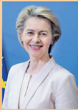
欧盟委员会主席冯德莱恩