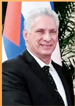
古巴国家主席迪亚斯-卡内尔