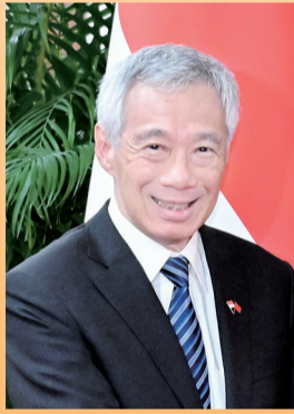
新加坡总理李显龙