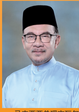
马来西亚总理安瓦尔