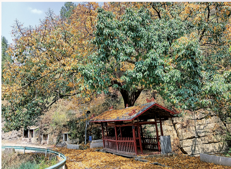
重庆人的专属浪漫:春天的落叶

昨天,重庆大部地区放晴,多地升温超过10℃。但,新一轮降雨已经在路上。重庆市气象台发布暴雨IV级预警,未来几天重庆都是雨,气温也将坐上“过山车”,各地日平均气温将下降6~10℃!