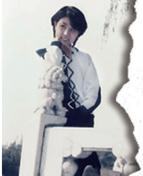
80年代的青年(资料图)