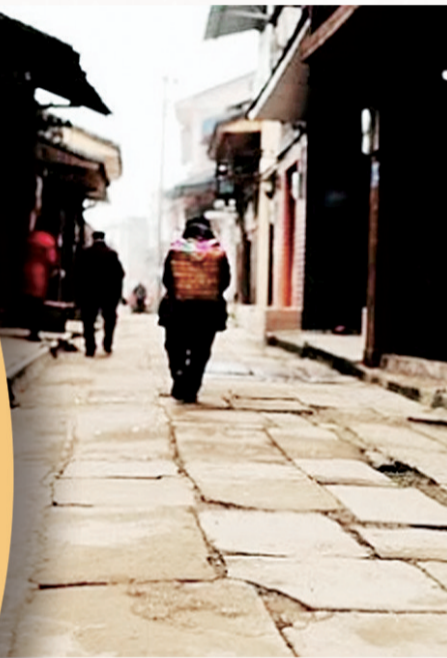
老街上的一大块青石板路诉说着当年的辉煌