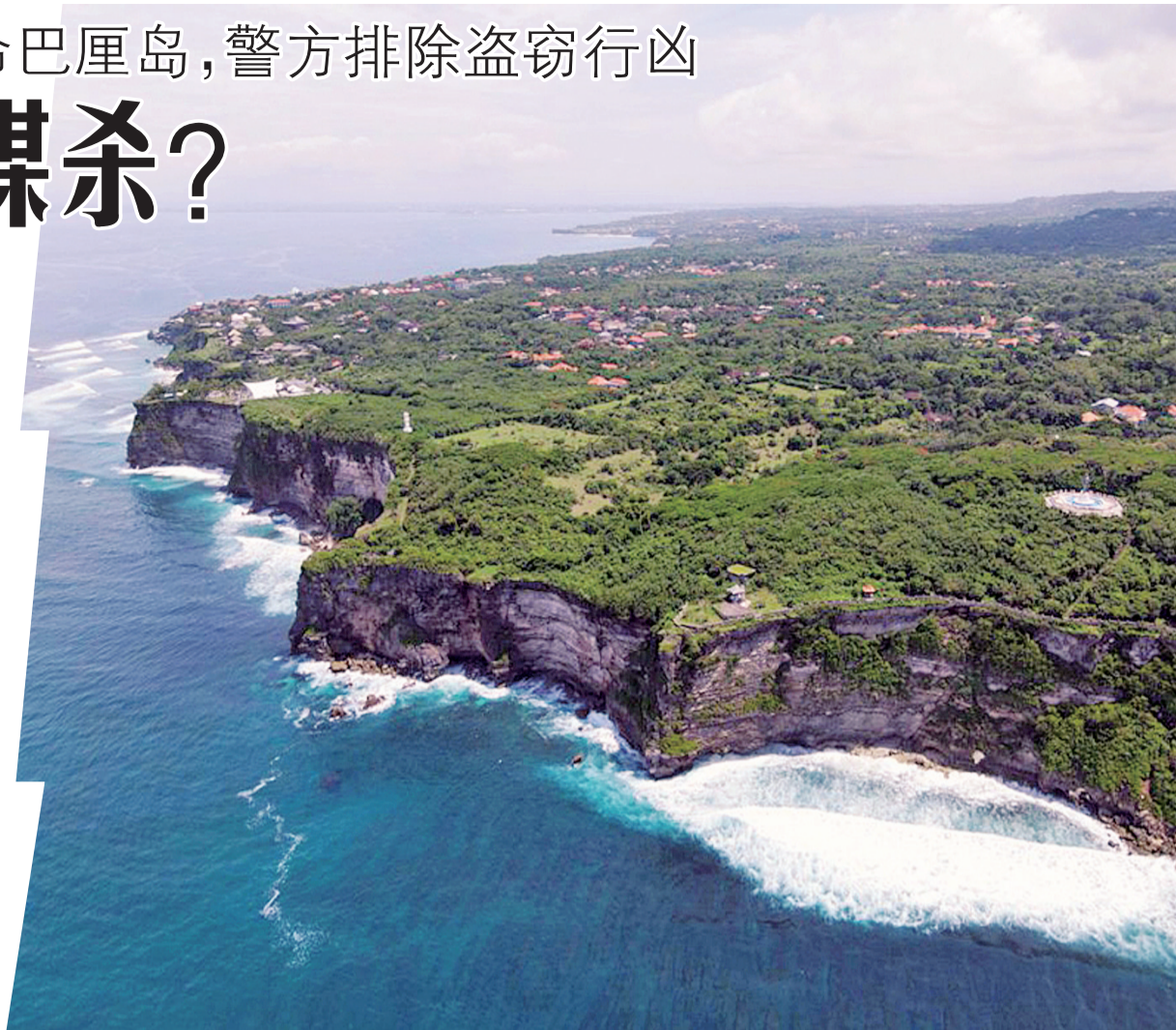
印度尼西亚巴厘岛情人崖