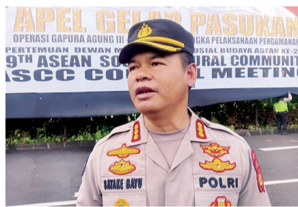
巴厘岛警察局发言人

据报道，酒店方至今未就该案件发表声明。5月7日，巴厘岛警察局发言人透露，针对这一案件，已有15名证人接受了调查。