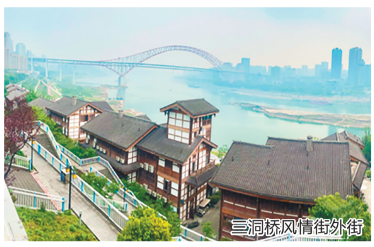
三洞桥风情街外街

此前，三洞桥风情街更是作为全国3个直播点之一登上央视，展现了有着浓烈巴渝特色的非遗文化糖关刀、捏面人、剪纸、竹画等活态展示。以文化铸魂，三洞桥风情街由此被推向全国，走进更多人视野。“借助外街塑形与塑魂的成功经验，内街三洞桥PARK 目标方向更明确。”江北嘴置业有限公司有关负责人表示。伴随城市提升行动及江北嘴中央商务区的建设走向深入，作为“两江四岸”特色资源的三洞桥还在不断“羽化”。按照打造成为与“两江四岸”风貌相融合精品项目的目标，街区“内外联合”正紧紧围绕历史、文化、艺术续写三洞桥的故事，将成为展示重庆城市品质和人文内涵的城市地标。 据华龙网