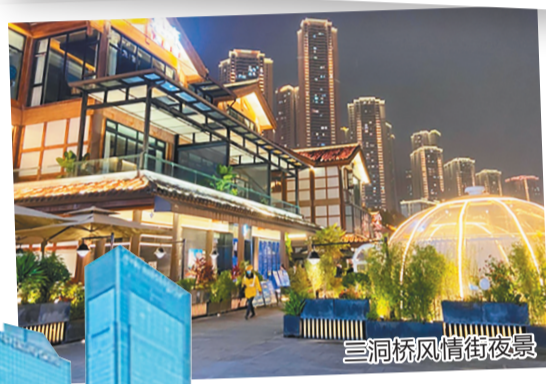
三洞桥风情街夜景