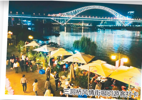
三洞桥风情街吸引游客打卡