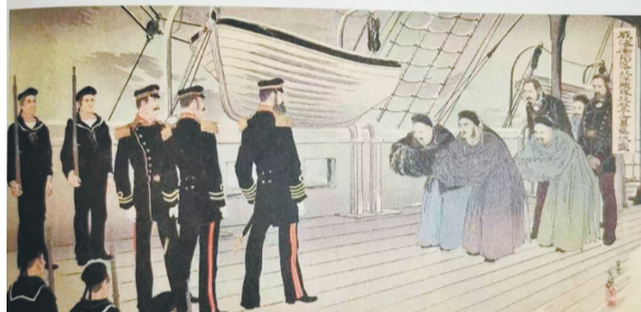
历史读物上标注的“丁汝昌投降图”

10册售价为300元。引发争议的“丁汝昌投降图”出现在该书讲述“威海卫战役与《马关条约》”的章节。记者在京东、当当网等网购平台上看到,该书仍在销售中。