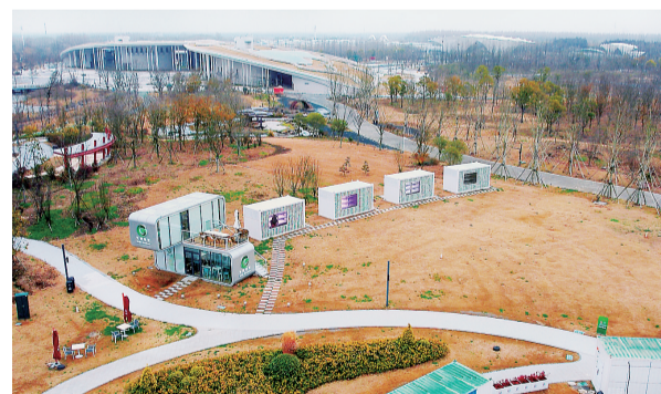
今年2月,第三届“多多农研科技大赛”决赛在上海崇明的光明母港垂直农业研究中心进行。

攻坚先进集体”称号。2021年8月,拼多多设立“百亿农研”专项,旨在面向农业及乡村的重大需求,不以商业价值和盈利为目的,致力于推动农业科技进步,科技普惠,以农业科技工作者和劳动者进一步有动力和获得感为目标。