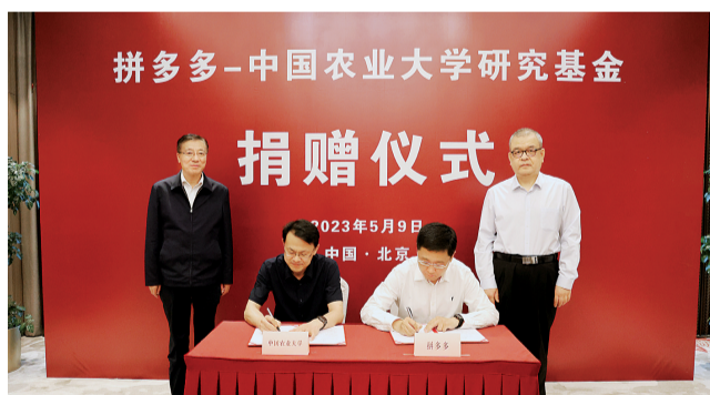
5月9日,“拼多多-中国农业大学研究基金”捐赠仪式在中国农业大学国际会议中心举行。

作为新电商,拼多多从农产品零售平台起家,开创了以拼为特色的农产品零售新模式,逐步发展成为中国最大的农产品上行平台,并获得党中央、国务院颁发的“全国脱贫