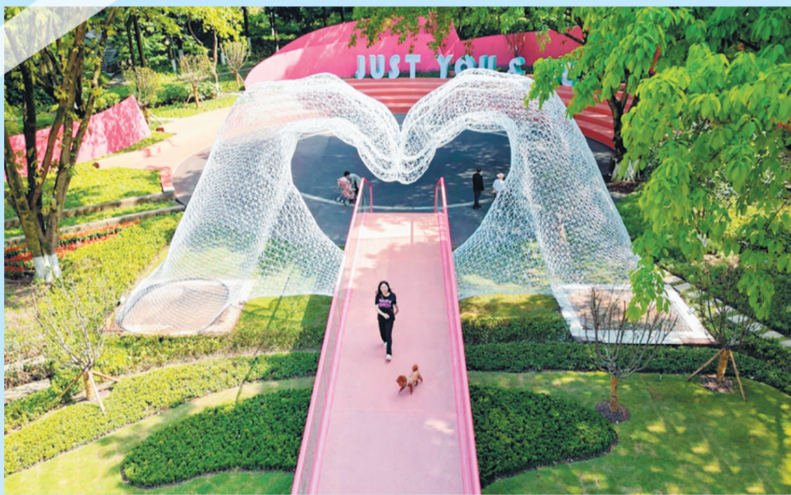
爱情公园焕新升级