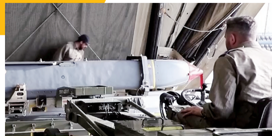
“风暴之影”巡航导弹