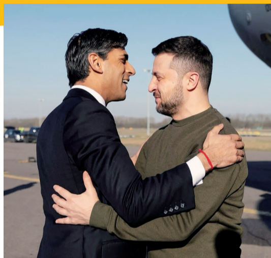
苏纳克与泽连斯基

今日俄罗斯电视台也援引乌方说法报道了类似消息。基辅军事行政长官谢尔盖·波普科在社交媒体上说，俄方在周二凌晨对基辅的目标进行了“综合攻击”，短时间内发射了多枚导弹，“密度非同寻常”。波普科还称，“基辅空域的大多数敌方目标都被探测到并摧毁了”。