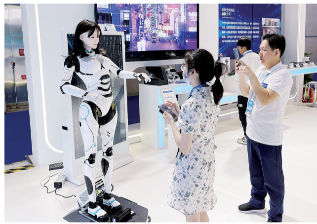
西洽会璧山展场,高仿真“美女”机器人小慧和观众打招呼,人机交流,她还能眨眼、做动作、播音等。