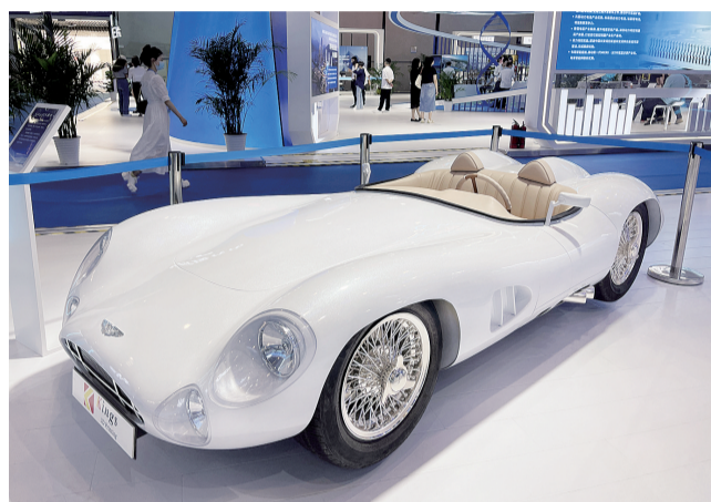
西洽会渝北展场,3D打印的炫酷跑车模型。