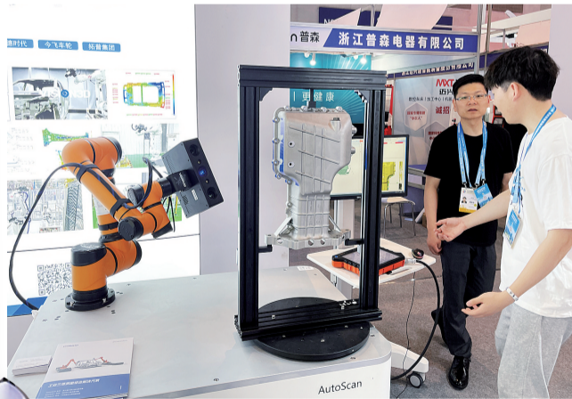
西洽会浙江展场,智能扫描机器人,能扫描它面前的物体结构和构造尺寸,然后进行“克隆”。