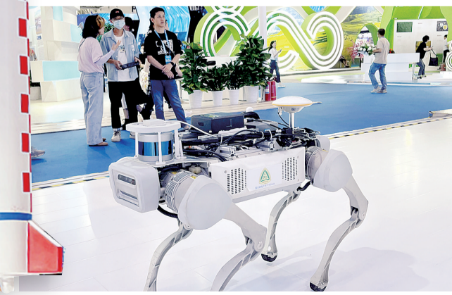
西洽会渝北展场,仙桃数据谷一家互联网通讯科技公司研发的智能机器狗,它能代替工人进入线缆隧道巡查、探查隧道内的温度、有害气体等情况。