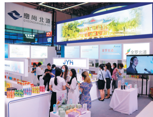
西洽会国际馆展区人气旺

5月18日下午，位于重庆市渝中区解放碑八一路大都会西楼的“国展全球市集”跨境新零售展销厅内，不时有市民游客进店选购进口商品，作为渝中区首家跨境新零售体验店，它以进口商品展示销售为基础，积极推进国际经贸交流，以首店、首秀、首发等方式帮助各国外资外商及相关产品在重庆布局，助推渝中区乃至重庆与各国经贸合作项目落地。