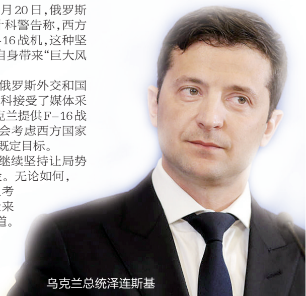
乌克兰总统泽连斯基