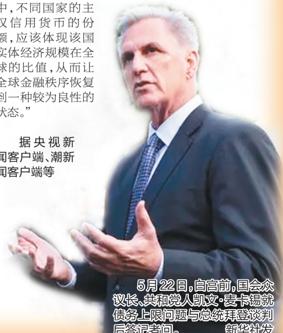
5月22日，白宫前，国会众议院议长、共和党人凯文·麦卡锡就债务上限问题与总统拜登谈判后答记者问。