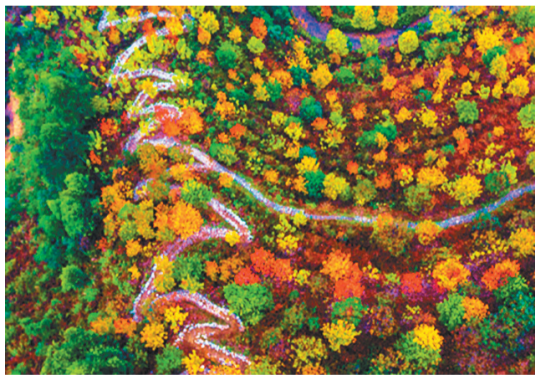
丰盛彩色森林景色