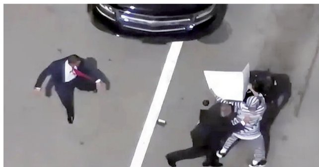
庭审结束后,抗议者举着牌子试图接近特朗普车队。