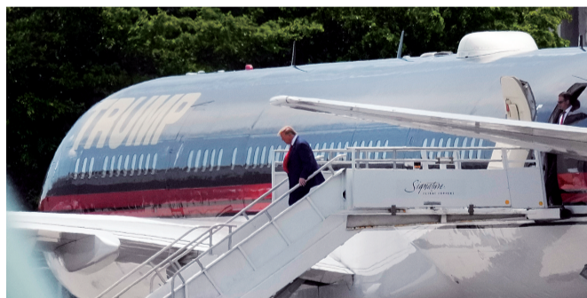
特朗普在迈阿密国际机场走下飞机