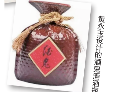
黄永玉设计的酒鬼酒酒瓶