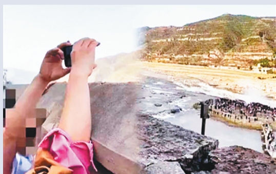
壶口瀑布沿途公路砌围墙挡