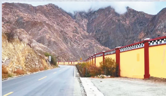
梅里雪山景区国道旁修建着围墙

不只是青海湖,据网友爆料,新疆赛里木湖如今也被围得严严实实。以前自驾的朋友们路过赛里木湖可以随意进去拍个照打个卡,而现如今这个被称为大西洋最后一滴眼泪的赛里木湖也要门票才能进去了。对于这些景点砌围墙、架围栏之事,不少网友感慨,还有什么不能围?