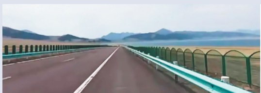
赛里木湖沿公路拉起了围栏