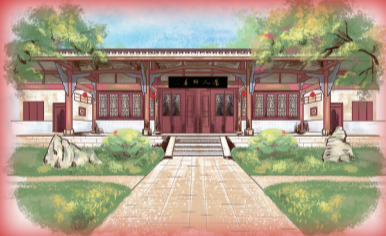
项家书院：古朴花石藤满壁， 典雅书香亭中环。