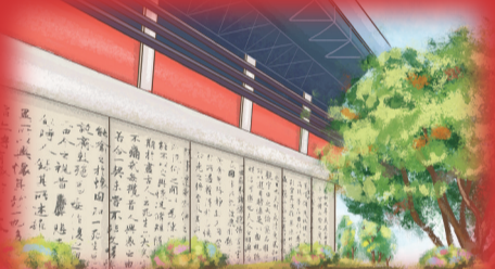
兰亭路：观翰墨书法赏横竖撇捺，品兰亭诗序思古往今来。