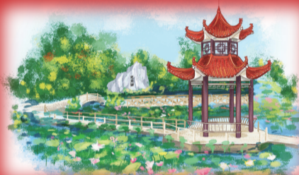
迎霞湖：清朗书生迎余晖万丈，拂风碧叶送朝霞漫天。