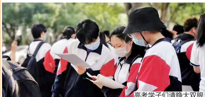
高考学子们请睁大双眼

山西理工学院 华北经贸管理学院 山西经济技术学院 山西信息工程学院 山西远东外国语学院 山西自修大学 山西建筑工程职业技术学院