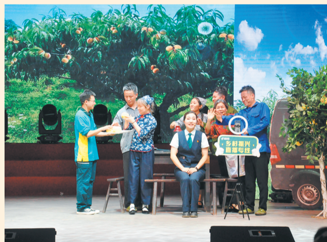
市国防邮电工会职工情景剧比赛

经过专家评审,重庆长安汽车股份有限公司《一个特殊的任务》获得一等奖;重庆建设工业(集团)有限责任公司《请党放心,强军有我建设人》和中国邮政重庆渝北片区分公司《坚守》分获二等奖;中电科芯片技术(集团)有限公司《一家亲》,中国邮政重庆合川片区分公司《我和直播有个约会》,重庆华伟工业(集团)有限责任公司《明天更美好》分获三等奖。