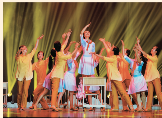
▲当代舞《老师,妈妈》(南岸区)