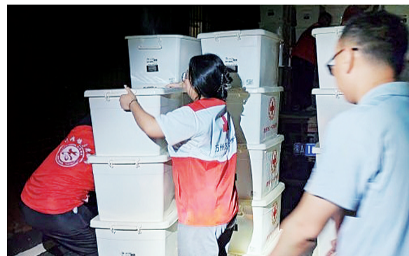
红十字会工作人员整理救灾物资