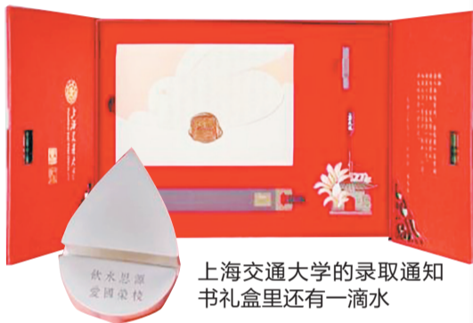
上海交通大学的录取通知书礼盒里还有一滴水

最近几年,各大高校开始在录取通知书上下足了功夫,各种各样精致、有创意的录取通知书让网友看花眼,更是给了新生满满的惊喜。2023年大学新生的录取通知书在飞奔而来的路上。今年,全国各大高校的录取通知书都有什么亮点?又有哪些巧思和寓意?