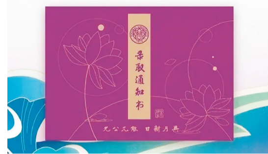
青莲紫底色,承载着无限期许“山高海阔,志在四方”。心形徽章盲盒,以日月山海为主题的徽章,寓意“散自有辉,合而为星”,两枚莲花种子,寓意“不改初心,见证成长”。