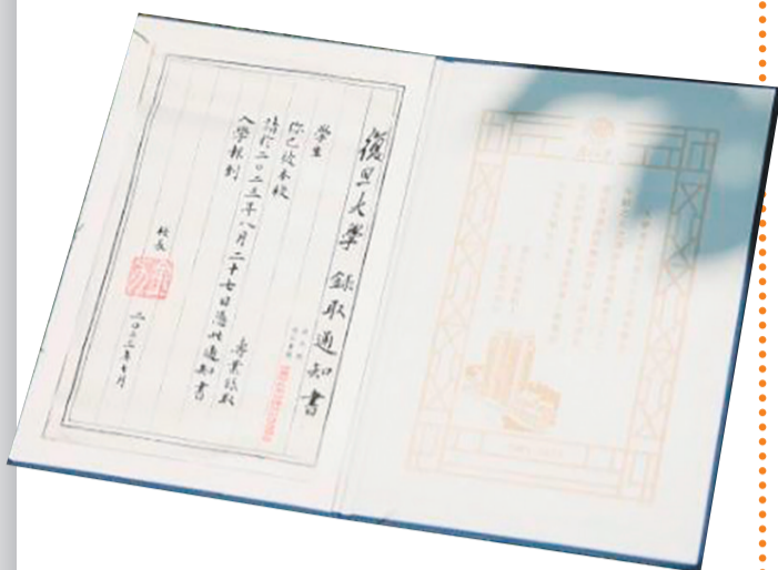
以开化纸为书写载体,“穿过时间长河,只为传递金榜题名喜讯”;设计古典,大师手写正文,名家创作刻印及版画“一笔一刻,都为优秀的你”。