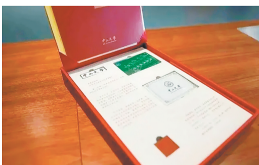
中山大学红砖样式的录取通知书套装,盒内还有绿色羊城通、来自云南凤庆的方形茶砖。期待这届新生一切为百年中大、祖国事业“添砖加瓦”。