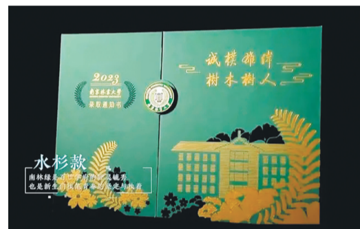
春生:花团锦簇婀娜浪漫;夏至:绿意盎然生生不息;秋韵:银杏丛丛丹桂飘香;冬语:银装素裹水杉如画。