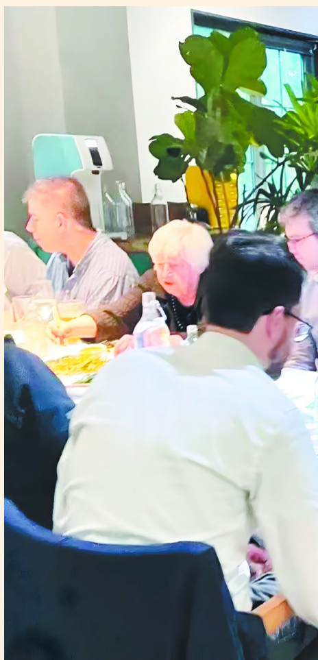
耶伦一行人在用餐