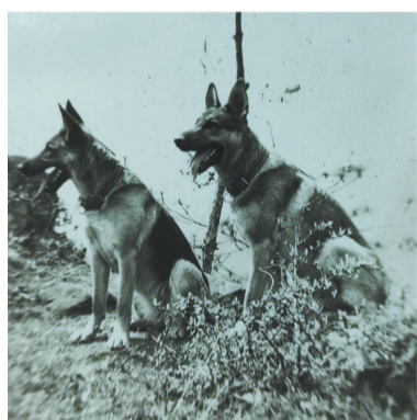
1985年,警犬海啸和海浪。