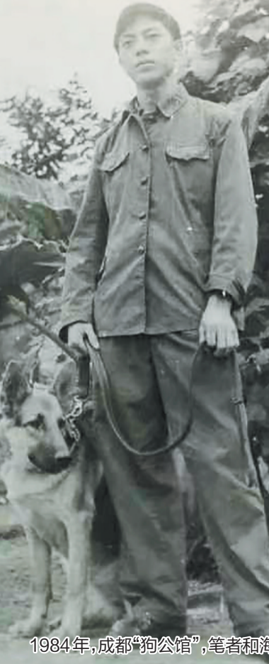
1984年,成都“狗公馆”,笔者和海啸。