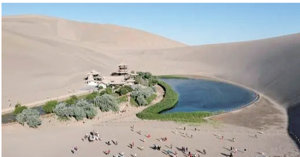
6月7日，甘肃敦煌鸣沙山月牙泉景区。