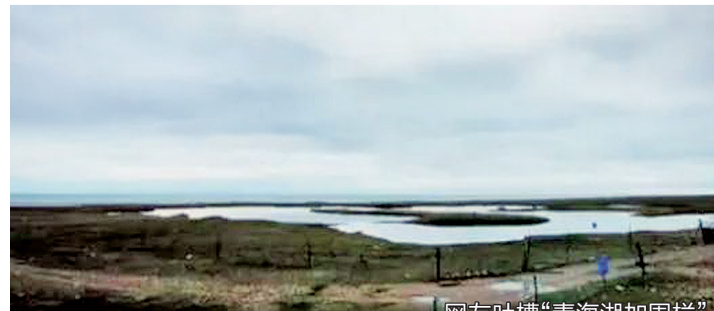
网友吐槽“青海湖加围栏”