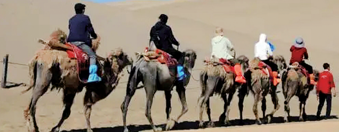
6月7日，在甘肃敦煌鸣沙山月牙泉景区，游客骑乘骆驼感受大漠风光。

如今，国内不少景区将游客集散中心与大门拉开一定距离，要进入景区乘坐摆渡车几乎成为必选项，这种情况引发了不少游客的吐槽。而国内旅游热门目的地青海湖也因环湖的铁丝网围栏引起舆论关注，不少游客质疑青海湖为收费而把景色“关起来”“严禁欣赏祖国大好河山”。