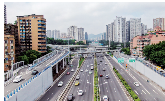
2023年7月22日上午，内环快速路沙区杨公桥段通行顺畅。

7月22日，内环快速路拓宽(沙区段)工程主线正式通车。作为市级重点工程，内环快速路拓宽(沙区段)工程起点接西环立交，终点接高家花园立交，将既有内环双向八车道拓宽改造为双向十车道，两侧各拓宽4.75米，主线单向长约5.48公里。该工程投用后将有效缓解目前内环快速路沙坪坝区范围内的拥堵，通行能力提升30%以上，方便市民出行的同时带动沿线经济社会发展。