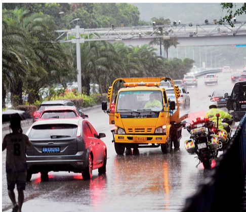
2023年7月21日，两江新区星光大道，交警在暴雨中拖移“趴窝”车辆。

昨日，重庆市气象局发布“暴雨Ⅳ级预警”，预计今日午后至26日白天，我市有新一轮强降雨，此次降雨影响范围广，过程持续时间长，部分地区累计雨量大，需防范暴雨诱发的地质灾害、中小河流洪水、山洪、城乡积涝等次生灾害。