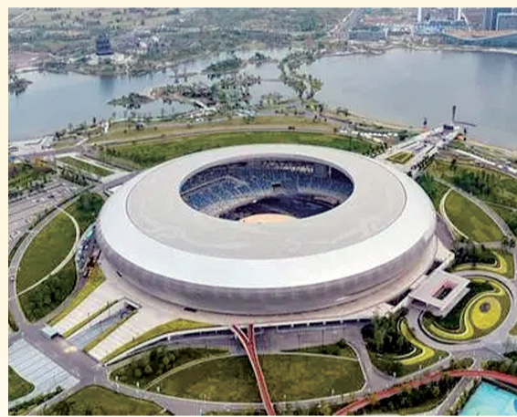
大运会开幕式举办地——东安湖体育公园主体育场。

鸟无论造型、寓意还是材质都令世人叹为观止。“这里的人们从远古时期就开始对太阳充满了热爱崇拜,而青年人本就是‘八九点钟的太阳’,代表朝阳,代表未来。”也因此,太阳神鸟贯穿在整个开幕式中。它不仅以光影的形式存在,而且现场还有一个特殊的灯光装置,在不同时刻作为太阳神鸟的意象发出耀眼的光芒。