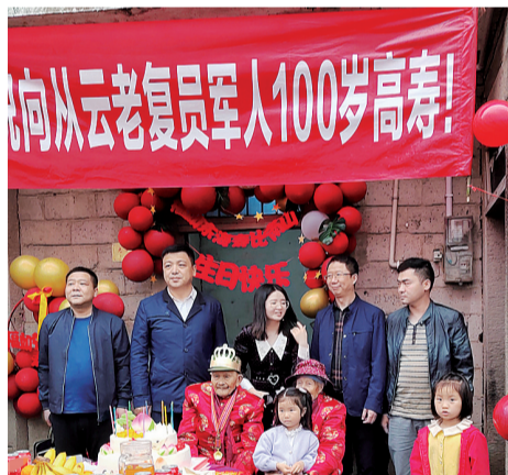
庆祝老兵百岁高寿