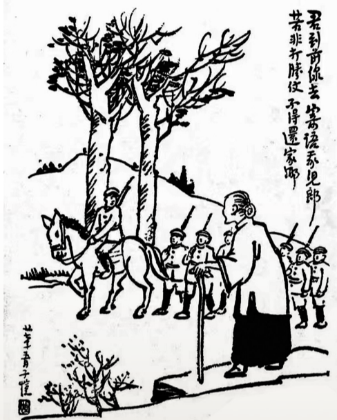
君到所依去，坐落係見郎，若非打勝仗，不得還家鄉