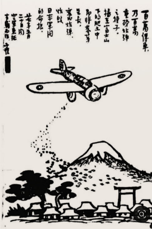
百萬軍車，重砂能彈，插五面山，下的肥土中，即時來爭，東而炸彈，炸毀，日本軍閥的命根