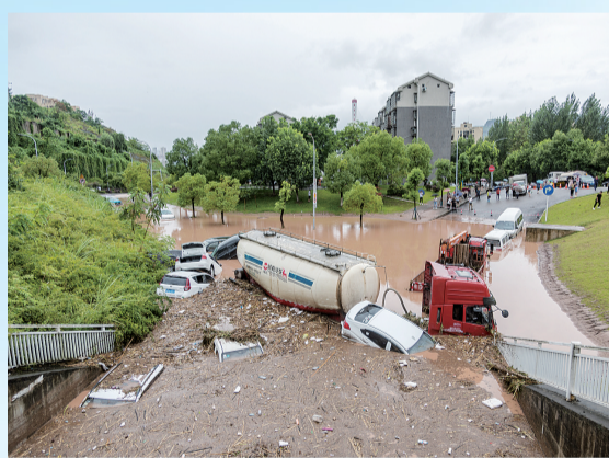
停靠在路边的车辆陷在洪水淤泥里

暴雨过后发现房屋漏水,首先应该查看《商品房买卖合同》和《住宅质量保证书》中发生质量问题的部位是否超过保修期。如在保修期内的,应当由房屋出卖人,即开发商承担修复责任;开发商拒绝修复或者合理