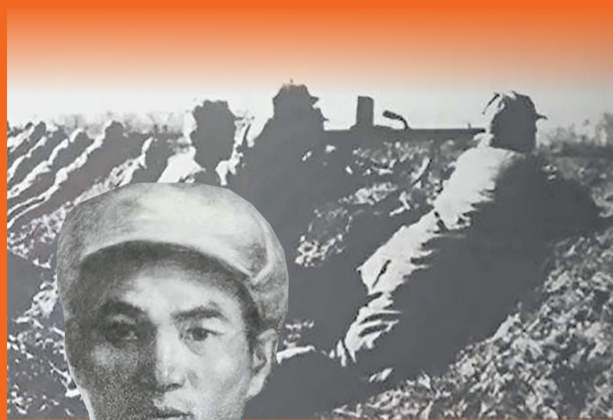
强攻大张庄战斗场面（资料图）