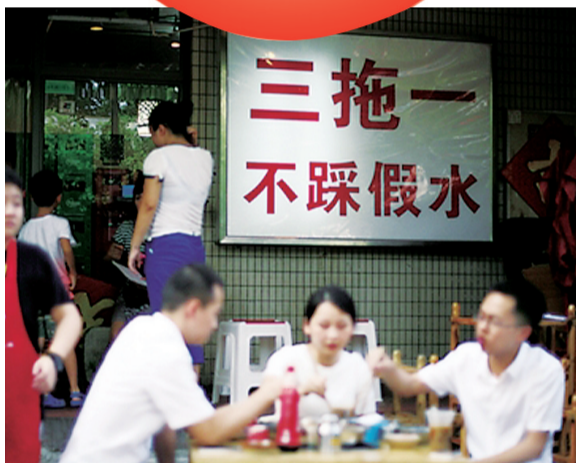
火锅店打出的“三拖一”招牌

庆著名的几家火锅馆，每天开门之前顾客就排着长队。尽管经营品种不及今天的三分之一，但生意爆棚的场景记忆犹新。上世纪90年代以前，重庆火锅馆通行“先买后吃”的经营模式，顾客先在柜台点菜付钱，凭票到窗口自取，如果中途需要添加，还得再次排队付钱开票，真是不胜其烦。日益增长的市场需求催生了民营经济的迅猛发展，也为“三拖么”的横空出世搭建了舞台。私营个体火锅馆星火燎原席卷山城，成为餐饮业主力军。它们与市场接轨的经营理念 and 灵活多样的营销手段，对国有企业传统的经营格局形成了巨大冲击，正是它们率先推行的“三拖么”亲民价格和先吃后算的服务方式，在火锅江湖纵横捭阖，闯出了一方新天地，赢得了广大消费者的欢迎。