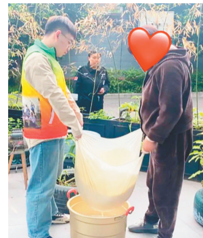
这家餐厅成了大家的“食堂”