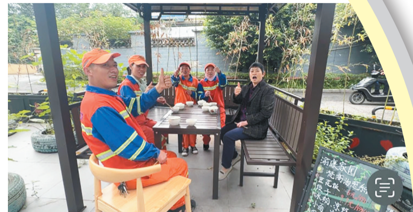
周围环卫工人们夸赞餐厅的美食