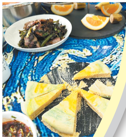
“治愈系餐厅”菜都比外面便宜