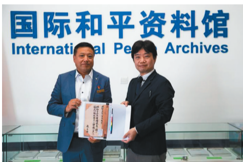
日本学者(右)将侵华日军731部队职员表影印资料赠予黑龙江外国语学院国际和平资料馆

日本扩军备战的种种迹象引发日本舆论批评和民众担忧。日本反战和平组织“和平构想建言会议”发表声明说,“三文件”将使日本再次成为能够发动战争的国家,从而在东亚煽动军备竞赛,是极其危险之举。日本山口大学名誉教授藤泽厚认为,“三文件”将加剧日本与亚洲邻国之间的紧张关系。