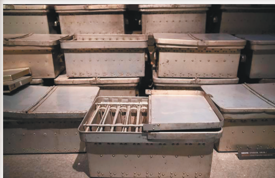
黑龙江省哈尔滨市侵华日军731部队罪证陈列馆内展出的细菌培养箱