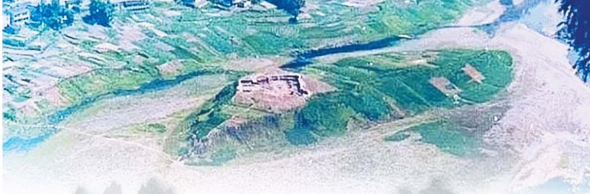
谿井沟遗址（中坝遗址）