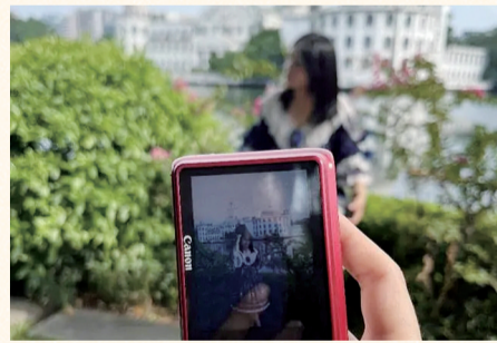
小顾喜欢用CCD相机为客人拍照