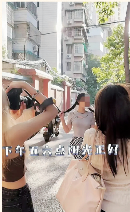
下午五六点阳光正好